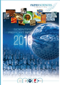
Couverture du Rapport d'activité 2010

Le Conseil Scientifique de la Fondation s'est réuni les 26 et 27 mai à Grenoble afin d'évaluer en détail les activités menées par la Fondation depuis la dernière réunion du Conseil, les 19 et 20 novembre 2009.